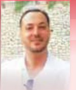
إعداد الفنان : محمد الشنطي Mohammad Shanti

□ □ إن من دواعي سرورنا في هذا العدد المميز ان نستضيف دولة صديقة ووفية لحقوق الشعب الفلسطيني ، كانت ومازالت تسعى جاهدة لاقامة السلام العادل والشامل من خلال دعم فكرة اقامة دولة فلسطينية مستقلة الى جانب إسرائيل، قدمت الكثير في بناء هيكل قوي للمؤسسة التنموية الفلسطينية في كافة القطاعات الحياتية ، انها النرويج الحليف القوي للعدالة الانسانية. وجدير بالذكر ان النرويج تعتبر من أكبر الداعمين الرئيسيين لمشروع القدس بتجمعنا وللمجلة ... القدس بتجمعنا إتلتت سفيرة النرويج هيلدا هارالستاد في مكتبها.